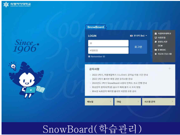
SnowBoard(학습관리) 금학기에 수강신청한 과목들의 온라인 강의실