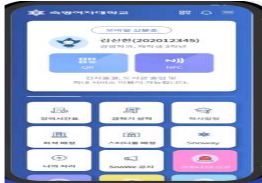
헤이영 (APP) 숙명 모바일 서비스 종합 어플리케이션